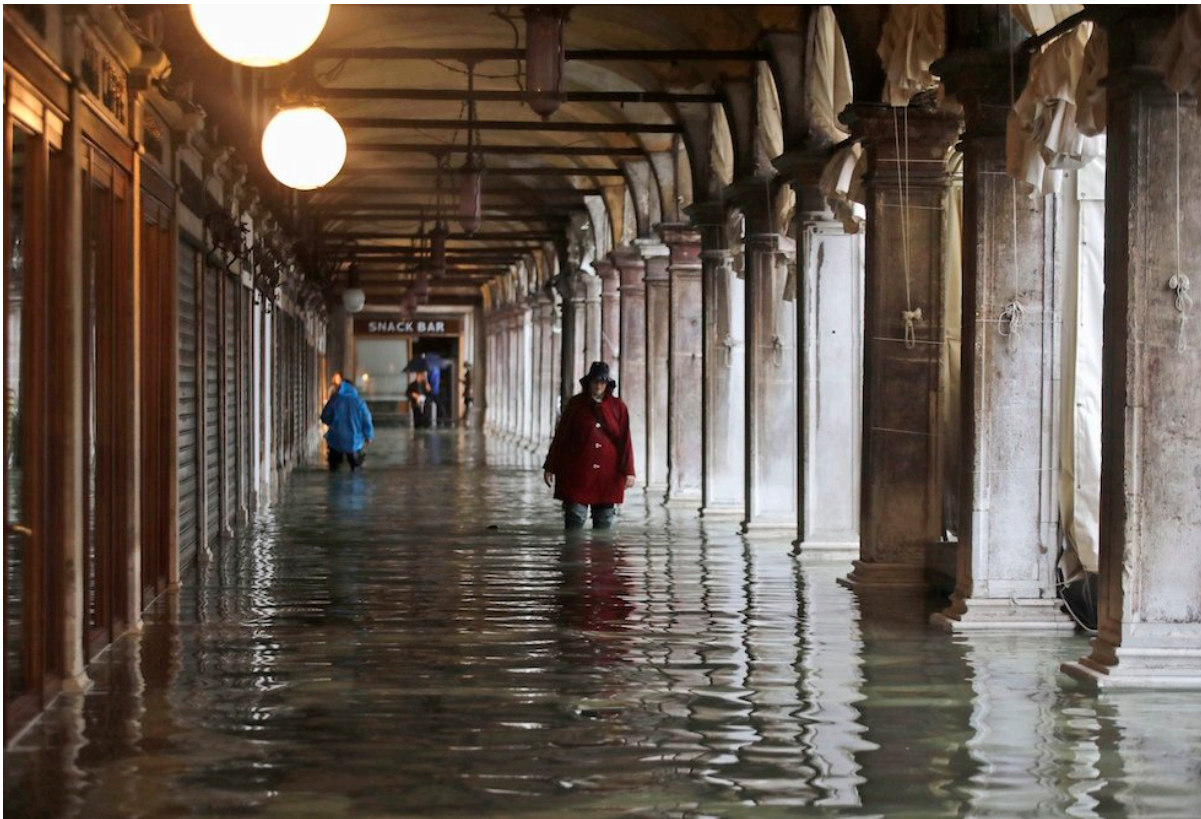
Venezia, 12 novembre

Raffiche di vento a 100 chilometri l'ora hanno raggiunto la città: gondole e altre imbarcazioni sono state sbattute sulle banchine.