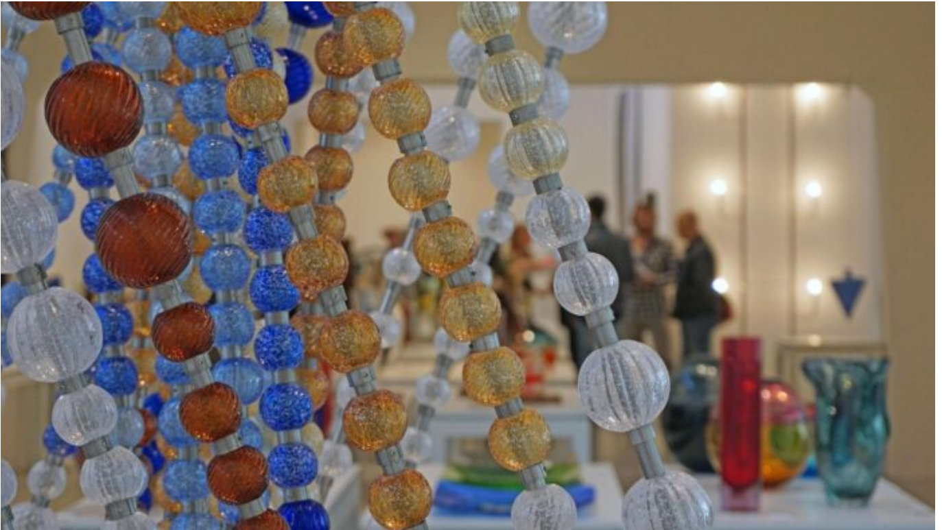
Perle di vetro veneziane (particolare della scultura Dynamei dell'artista Michela Vianello, realizzata per la fornace Andromeda).

stata inserita dall'Unesco nel "patrimonio culturale immateriale dell'umanità".