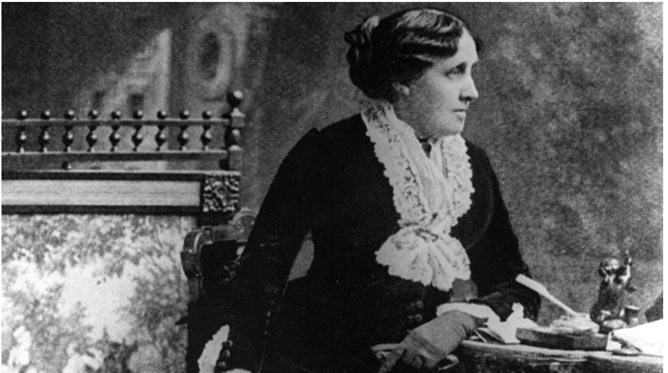
Louisa May Alcott matura