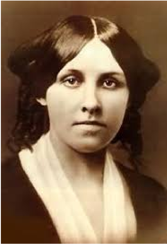
Louisa May Alcott giovane

Una delle sorelle Alcott, Lizzie, muore molto giovane a causa della scarlattina.