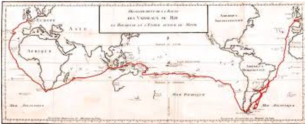
Ecco la rotta del viaggio di Bougainville