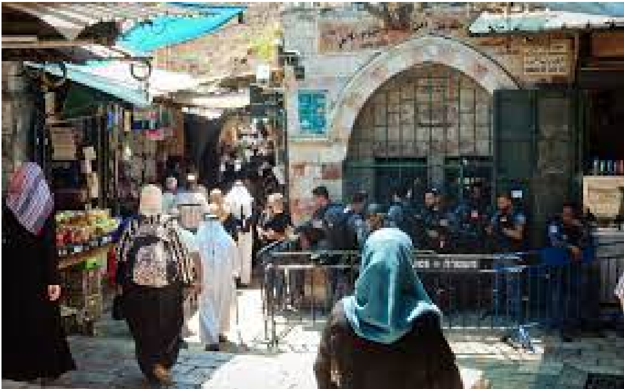
Vita quotidiana di arabi israeliani a Gerusalemme Est

Finora, comunque, nella storia politica israeliana nessun partito di arabi israeliani è mai entrato nella maggioranza di governo.