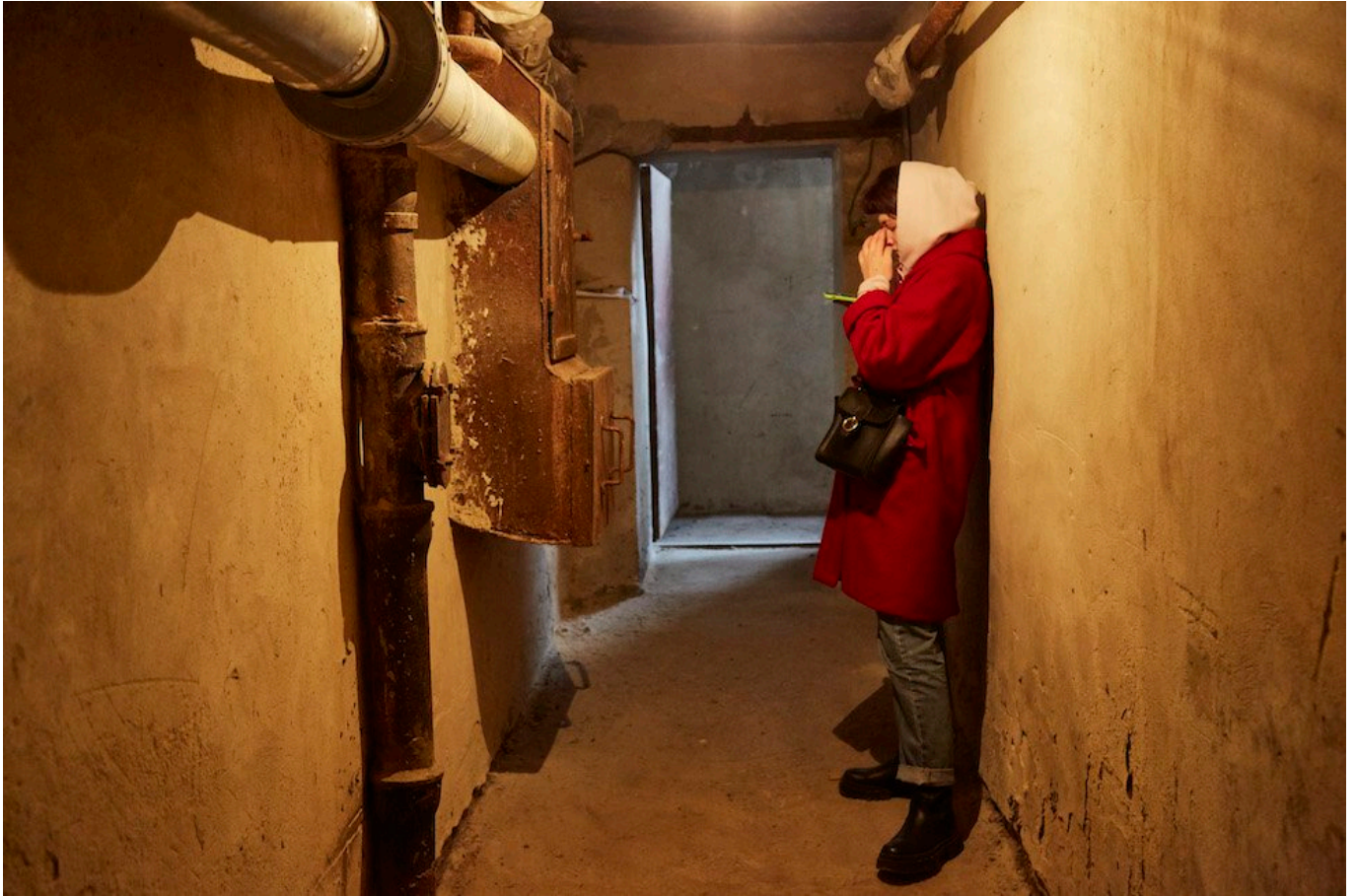
Una persona in un rifugio antiaereo, Kiev