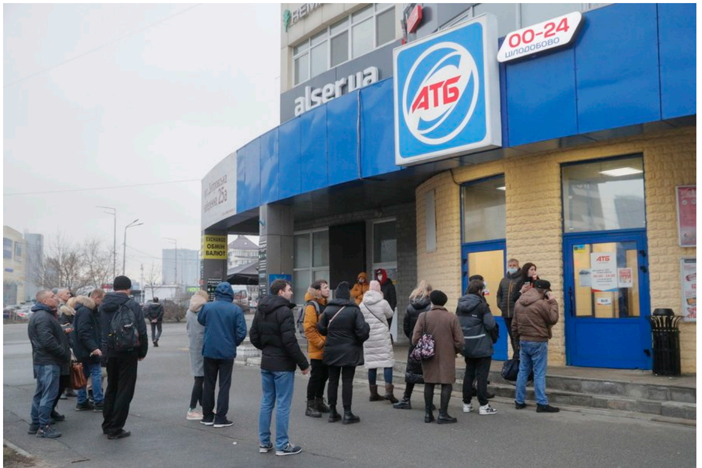
epa09780297 People stand in line outside a grocery store in Kiev (Kyiv), Ukraine, 24 February 2022. Russian troops entered Ukraine while the country's President Volodymyr Zelensky addressed the nation to announce the imposition of martial law.

Forse l'aspetto che più spaventa e l'apparente calma delle persone, come se fuggire dalla propria città fosse normale.