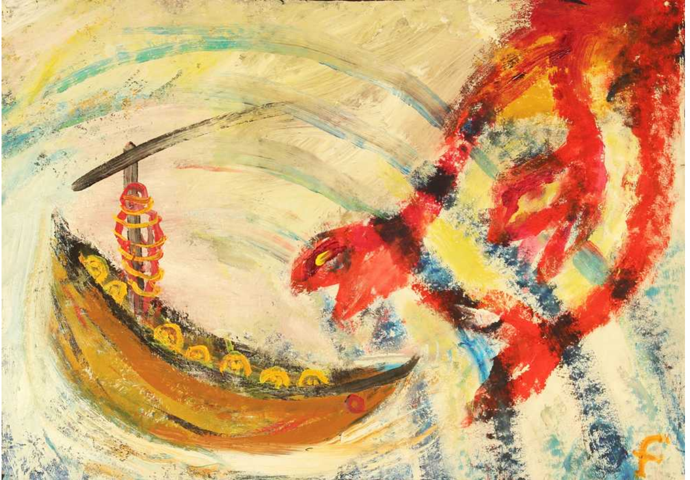
L: Ferlinghetti . Il quadro dal titolo Ulisse tra Scilla e Cariddi

Negli ultimi anni di vita si dedicò alla pittura.