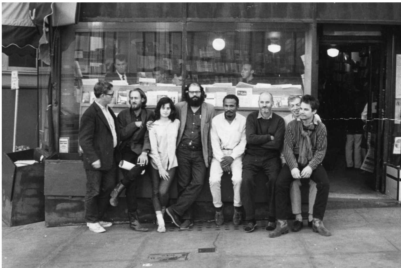
Ferlinghetti e Allen Ginsberg con un gruppo di amici davanti alla libreria City Lights, San Francisco 1963

La Beat Generation fu conosciuta in Italia nella metà degli anni '60 grazie alle traduzioni di Fernanda Pivano .