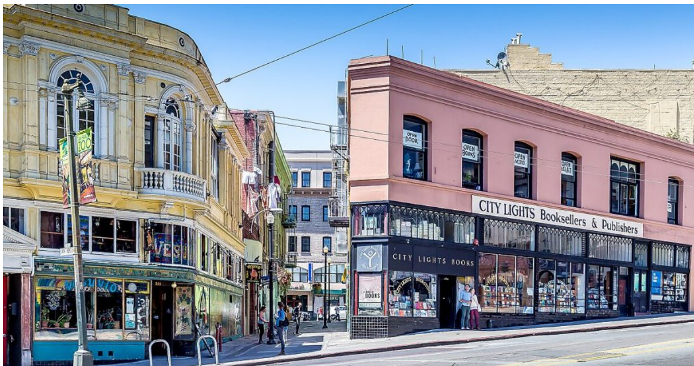
San Francisco la libreria City Lights