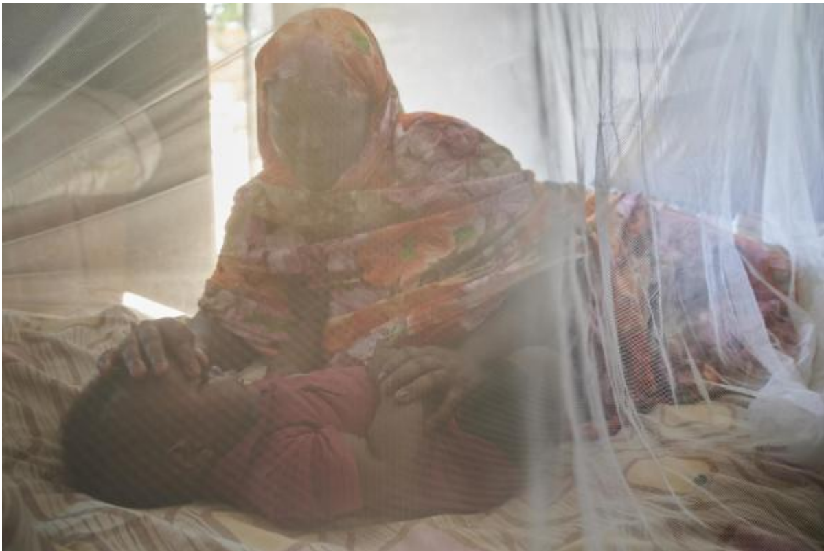
foto di un bambino sotto una zanzariera, campagna Unicef per donare zanzariere .

L'uso sistematico delle zanzariere, infatti, ha ridotto le morti dei bambini sotto i 5 anni del 20 per cento, cioè 80 mila bambini.